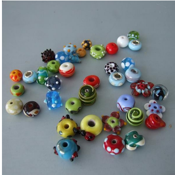
Perlen aus dem Kurs 2011