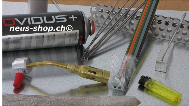
Dosenbrennerset für Starter