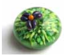
Grünes Gras Green Grass