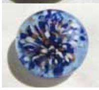
Die Fritten- Implosion ist für alle Mischungen mit opaken Fritten geeignet.