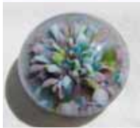
Frühlingsbrise Spring Breeze