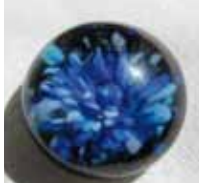
Wildes Wasser Wild Water