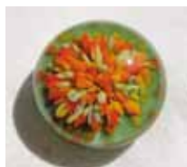
Sommerwiese Summer Meadow

Tutorial für Frittenimplosionsperle mit Anleitung für Wechselringaufsätze und geschraubte Anhänger